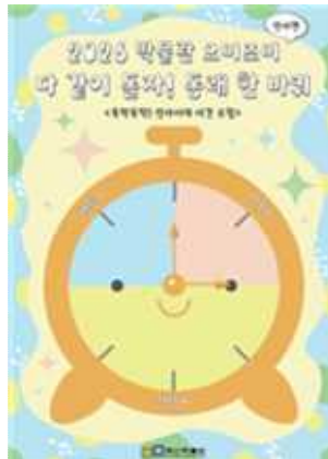
똑딱똑딱 선사시대 시간 모험 활동지