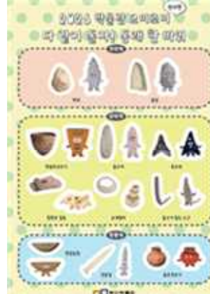
유물 캐릭터 스티커